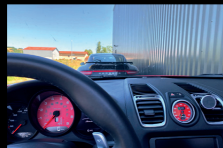
Tout est possible chez LJ MécaSport, y compris la personnalisation des coloris des fonds de compteur, du pack chrono et des ceintures de sécurité sur l'ensemble de la gamme Porsche