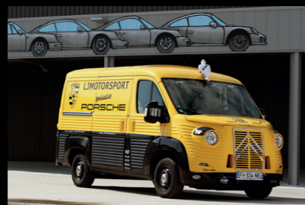
L'un des "jouets" de l'univers LJ, une authentique estafette publicitaire Amora récemment achetée à la Société du Tour de France