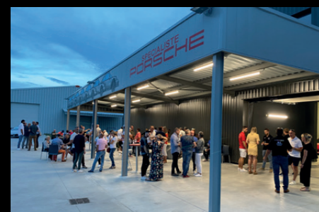
Plus de 150 clients étaient de la partie lors de l'inauguration de LJ MécaSport le 2 juillet