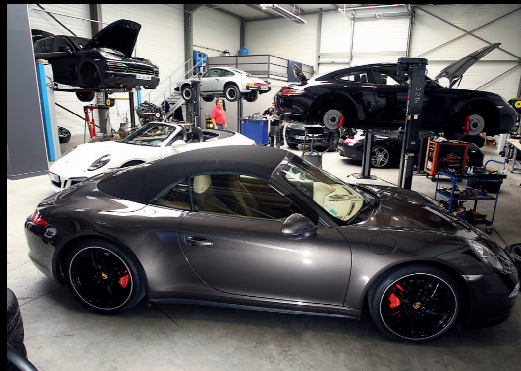
Les 600 m 2 ont été spécialement aménagés en vue de travailler dans les meilleures conditions. On y trouve, entre autres, 5 ponts élévateurs dont 1 pont ciseaux