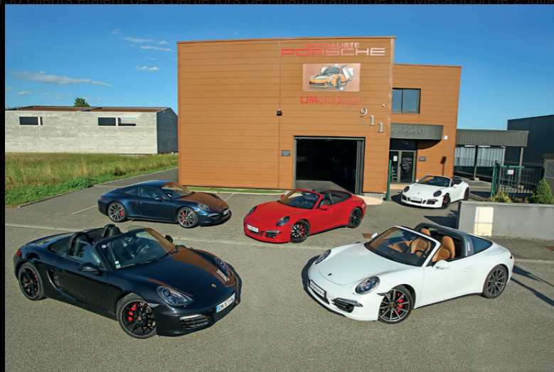
En l'espace de 10 ans, LJ Motorsport s'est imposé parmi les spécialistes Porsche français de confiance. 2021, année Covid, a même été une année record pour l'équipe avec plus de 200 Porsche vendues contre 145 en 2020 !