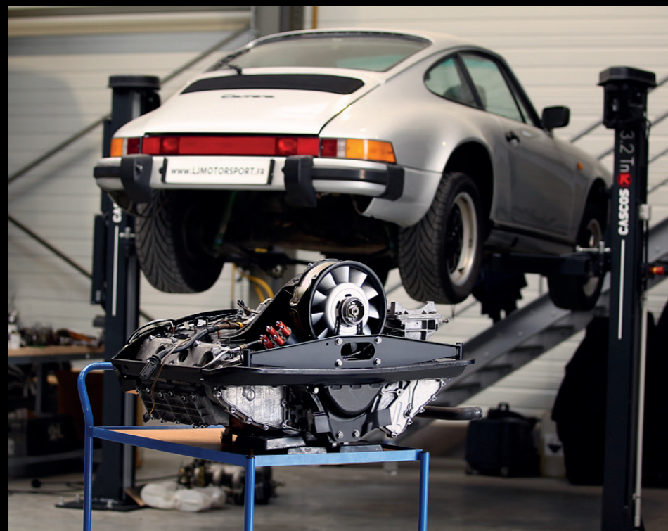
LJ MécaSport opère sur toute les générations de Porsche, anciennes comme modernes, qu'il s'agisse des 356, des 911, des Boxster, des Cayman, des Cayenne, des Macan ou des Panamera