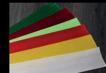
Vous souhaitez assortir la teinte de vos ceintures de sécurité à celle de la carrosserie de votre Porsche, aucun problème...