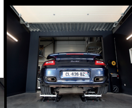
Le sas d'accueil et son pont spécialement dédiés à l'analyse des Porsche en présence de leurs propriétaires afin de faire un point sur les opérations à effectuer